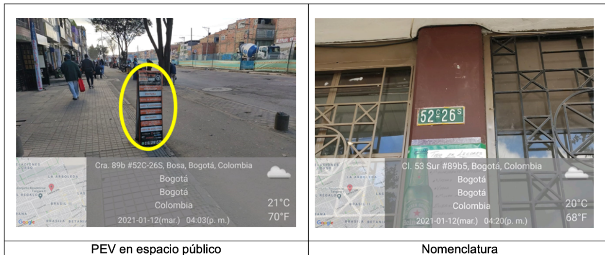
PEV en espacio público